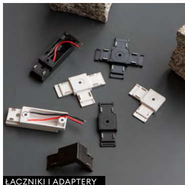
ŁĄCZNIKI I ADAPTERY